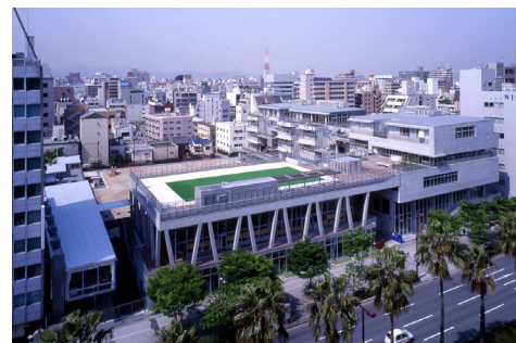
福岡市立博多小学校 | 2001年